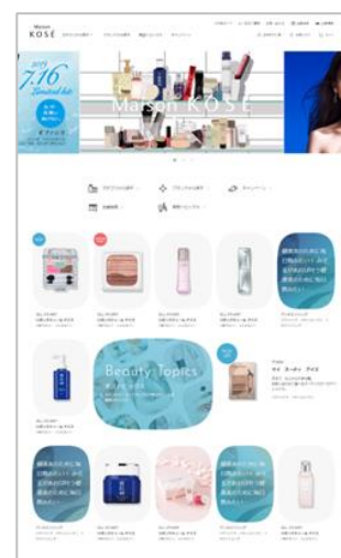
【オウンドメディア イメージ】

「Maison KOSÉ」では、これまでそれぞれの顧客接点で一方向に発信していた情報を、全方位かつ双方向で有機的に結びつけ、お客さまの利便性の向上を図るとともに、“Find Your Own Beauty”をテーマに、デジタル技術を活用した化粧や美容に関わる様々な体験を、当社の展開するすべてのブランド※1から楽しむことができます。“私らしい美の発見”を、よりパーソナルに、より気軽に、ご自身で叶えることができます。