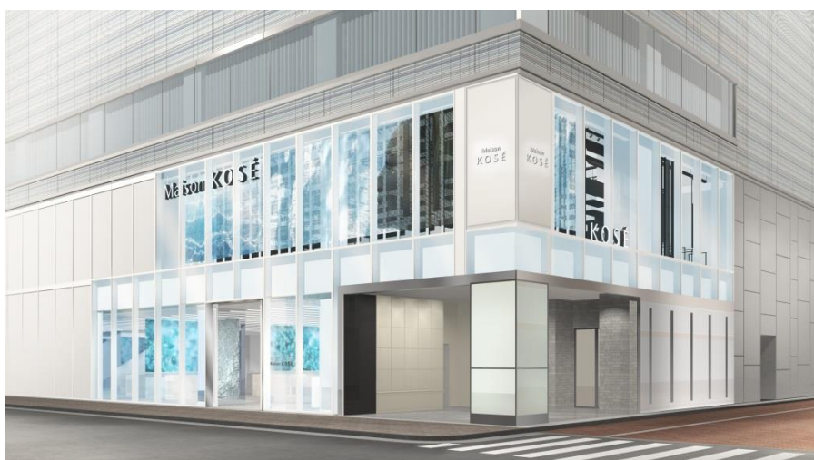
【Maison KOSÉ 外観イメージ】