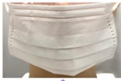
正面から紫外線を当てる