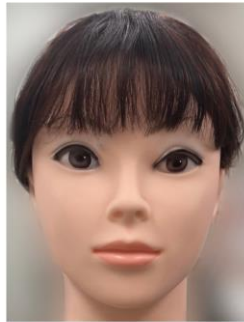
紫外線で紫色に変わる塗料を塗ったマネキンに一定時間正面から紫外線を照射