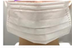
上から紫外線を当てる