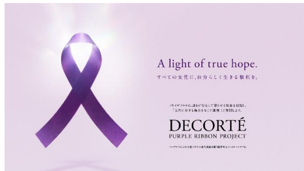
「DECORTÉ PURPLE RIBBON PROJECT」キービジュアル

『コスメデコルテ』は、「A light of true hope すべての女性に、自分らしく生きる権利を。」というメッセージを掲げ、すべての女性たちの暮らしと未来を守り、ジェンダーギャップを解消するために、独自の取り組み「DECORTÉ PURPLE RIBBON PROJECT」を立ち上げ、様々な支援を行います。また、内閣府が毎年11月に推進する「女性に対する暴力をなくす運動※2」に賛同し、パープルライトアップや寄附など、社会に対する啓発と被害者支援の両面から取り組み、女性に対する暴力のない社会の実現に貢献します。