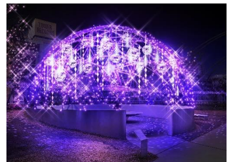
スノードーム イメージ

本ライトアップは、「MIYASHITA CHRISTMAS PARK 2022」と連動し、テーマ「#LOVE PURPLE」に合わせ、同運動のシンボルである「パープルリボン」と、ブランドを代表する“リボソーム美容液”を象徴するパープルのカラーで宮下公園を彩ります。「#LOVE PURPLE」には、“赤色と青色が混ざり合ってできるパープルのように、ダイバーシティの街・渋谷の中心であるMIYASHITA PARKで、多様な人が混ざり合い、認め合い、大切にしよう。”というメッセージが込められており、女性に対するあらゆる暴力の根絶を広く呼びかけます。