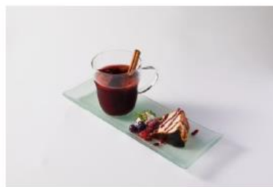
GRAN SOL TOKYO

情報発信基地である MIYASHITA PARK を起点に、全国各地の百貨店や化粧品専門店でもイベントを開催するなど、お客さまや流通パートナーの皆様と共に、運動に対する理解促進と認知拡大を図ります。自社オウンドメディアを活用した情報発信の他、交通広告の展開やビューティコンサルタント(BC)のピンバッジの着用、啓発ペラの配布など様々な活動を行っていきます。