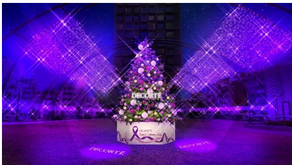
「DECORTÉ Purple Lightup 2022」イメージ

さらにメタバース空間「バーチャル渋谷」と、宮下公園のバーチャル空間「渋谷区立宮下公園 Powered by PARALLEL SITE」でも相互連携し、空間内をパープルにジャックします。この2つが同時に同じイベントを行うのは、初めての試みとなります。