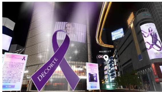
「バーチャル渋谷」イメージ