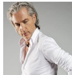
マルセル・ワンダース氏

2010年から「コスメデコルテ AQ MW」のアートディレクターを務め、2016年には、同ブランドのスキンケア商品が、国際的なパッケージデザインのコンペティションである「ペントアワード2016 10th ANNIVERSARY 特別コンペティション」で金賞を受賞 ※8 。2017年オープンの「Maison DECORTÉ ※9 」のデザインを手掛ける。