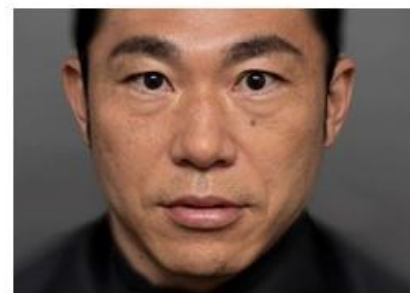
40代：ナチュラルメイク