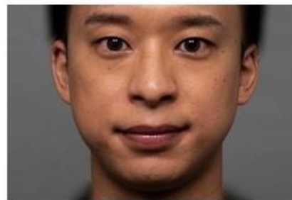
20代：ナチュラルメイク