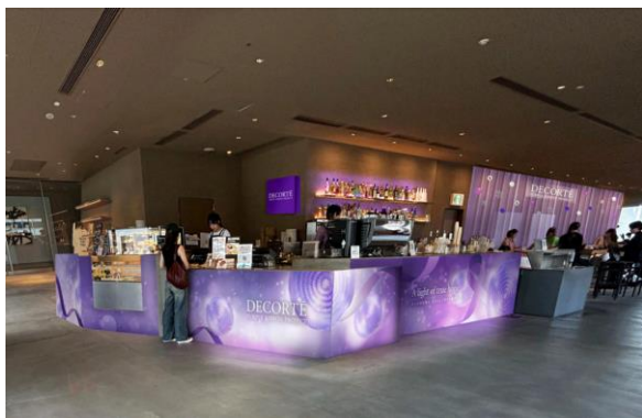
カウンターイメージ

また、今年はホテル「sequence MIYASHITA PARK」と同ホテル4階のカフェ「VALLEY PARK STAND」とのコラボレーションを11月12日(金)から11月18日(月)まで実施。カフェ店内には、リポソームシリーズの商品体験ができるコーナーを設けるだけでなく、カウンターをパープルのカラーでラッピングし、オリジナルメニューも用意します。