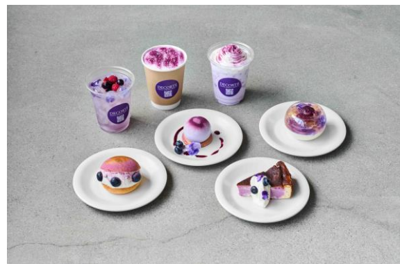
オリジナルメニューイメージ

館内各所にプロジェクトのポスターを掲示する他、ホテル「sequence MIYASHITA PARK」と「RAYARD MIYASHITA PARK」の対象店舗とコラボレーションし、ご利用の方には先着で、「リポソーム アドバンスト リペアセラム」と「リポソーム アドバンスト リペアクリーム」のサンプルをプレゼント ※3 します。