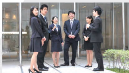
多様性を尊重する職場へ Toward a work place that respect diversity

2017年度「健康経営優良法人ホワイト500」に認定 Certified as "Company with Excellent Health Management (White 500)" in fiscal 2017