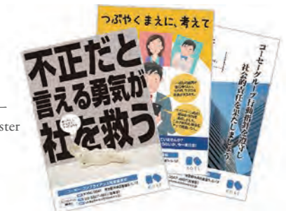
「コンプライアンス啓蒙月間」のポスター Compliance awareness month poster

Furthermore, we have established Risk Management and Compliance Committee to raise awareness and respond to issues. We regularly hold lectures for management level employees and carry out risk assessment reviews, regular compliance training through e-learning for employees in Japan and overseas, place compliance awareness month posters, provide beauty advisors shot comics in materials periodically published for education.