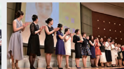
グローバルEMBコンテスト 授賞式の様子と最終選考に勝ち残った17名の美容スタッフ Award ceremony of Global EMB Contest and 17 beauty advisors finalists of this Contest