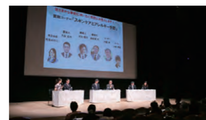
スキンケアによるアレルギー予防の公開講座を開催 Lecture on Skin Care and Allergy Prevention

▶KOSÉ Beauty Academy www.hairmake.ac.jp/