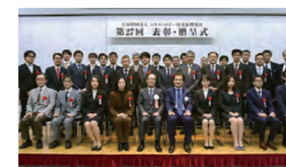
公益財団法人コスメロジー研究振興財団 表彰・贈呈式 Award ceremony of Cosmetology Research Foundation