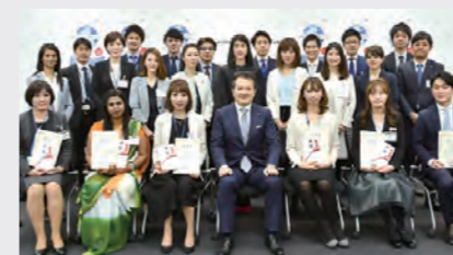
海外を含めた商品化アイデアコンテスト New Product Idea Contest including overseas

Beauty advisors are responsible for adding further value to cosmetics through attentive service, which requires hospitality and also specialized knowledge and skills. As such, we offer various programs to improve their skills. In fiscal 2015, we introduced the Make-up Lesson Examination approved by the Ministry of Health, Labour and Welfare to contribute to the skills of beauty advisors and raise awareness. A national contest to compete comprehensively in make-up and service skills held since 1975 has been expanded to include overseas as The Global EMB Contest from fiscal 2011. In fiscal 2016, 17 of our staff members from Japan and abroad made it to the final round of the contest.