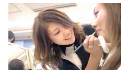
コーセー美容専門学校 KOSÉ Beauty Academy