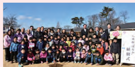
坂東市内の保育施設でさくらの苗木を植樹 Planting cherry blossom seedlings at childcare facility in Bando City