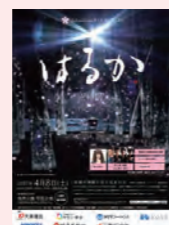
福島県白河市内のプロジェクションマッピングイベントに協賛 Sponsored projection mapping event in Shirakawa City, Fukushima

▶詳細 Details www.kose.co.jp/company/ja/csr/theme5/ ▶お問い合わせ Inquiries www.kose.co.jp/jp/ja/inquiry/