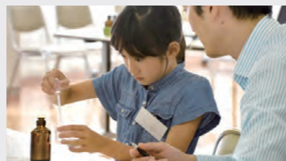
研究所で実施した社員の親子見学会の様子 Worksite visit by employees' children at the Research Laboratory