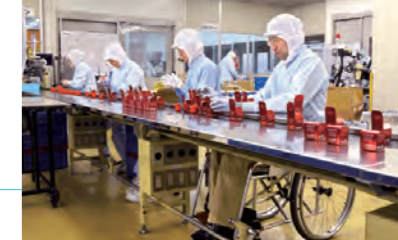
車いすでも作業がしやすい設計(特例子会社 アドバンス) Designed for ease of use even from a wheelchair (ADVANCE special subsidiary)